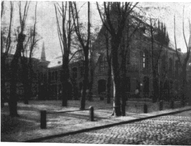
Der Mönchenkirchhof seit 1891 (Aus: Teden, Geschichte der Seestadt Wismar)